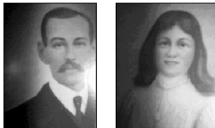
Målningar gjorda av Systrarna Bang!

Systrarna hade alla former av mediumskap. Automatisk skrift mellan två stenplattor var något de hade stor framgång med bl.a.