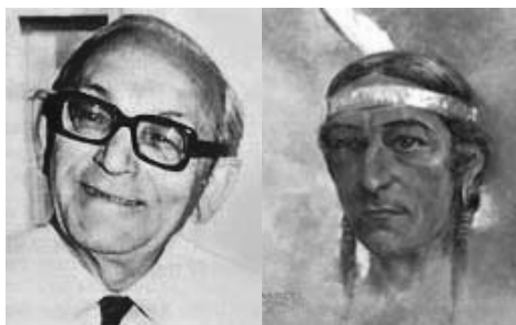
Maurice Barbanell Silver Birch